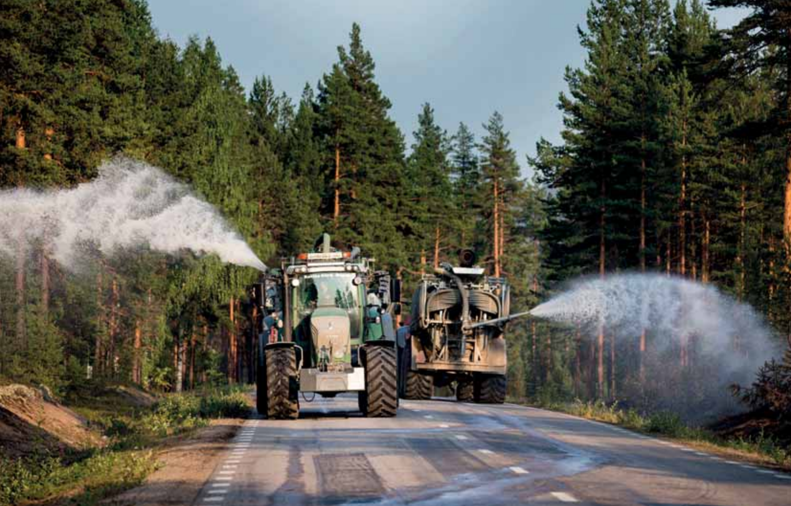
Svenske bønder deltager her i bekæmpelsen af skovbrandene i 2018 – ligesom 12.000 andre svenskere gjorde på frivillig basis.

Villigheden til at hjælpe hinanden ved kriser er helt afgørende for, hvorledes man kommer igennem krisen. Ifølge en undersøgelse fra 2018 vurderer otte ud af ti svenskere, at frivillige har haft en stor betydning i håndteringen af samfundskriser i årene forud. Næsten ni ud af ti kan selv forestille sig at være frivillige i tilfælde af en alvorlig social krise. Samtidig ved godt seks ud af ti ikke, hvilken organisation de skal henvende sig til.